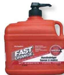
Kanister 1890 ml