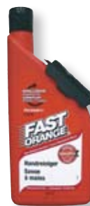
Flasche 440 ml