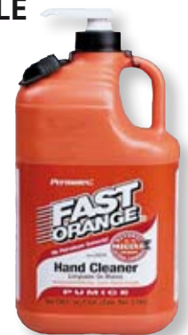
Kanister 3780 ml