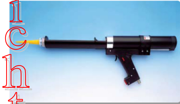
Original Design & Herstellung