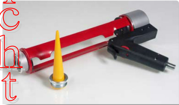
Original Design & Herstellung