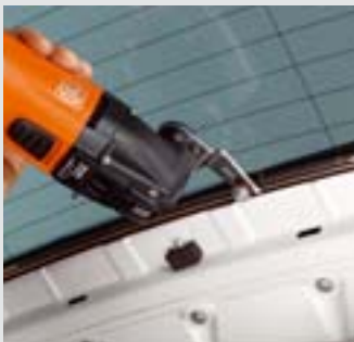
Mit dem Schneidmesser Form 143 und verstellbarer Anschlagrolle lassen sich Seiten- und Heckscheiben einfach und schnell von innen ausglasen. Empfohlene Geschwindigkeit: max. Stufe 3.