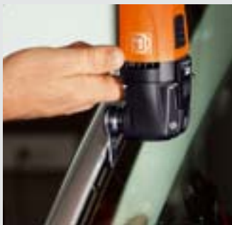
Mit dem L-Messer haben Sie bei gleicher Geschwindigkeit eine um 40% höhere Schnittleistung als bei einem vergleichbaren U-Messer. Beschädigungen an der Karosserie sind nahezu ausgeschlossen. Empfohlene Geschwindigkeit: Stufe 3–4.