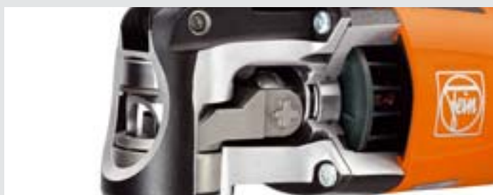
Extrem stabiles Getriebe – für höchste Beanspruchung ausgelegt.