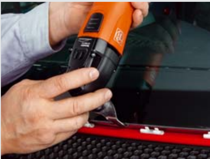
Für das Ausglasen unter der Motorhaube kommen die U-Messer zum Einsatz. Empfohlene Geschwindigkeit: Stufe 3–5.