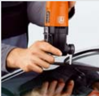
Gekapselte Windschutzscheiben und anvulkanisierte Rahmen, auch mit Aluminium-Verstärkung, lassen sich mit dem L-Messer in einem Arbeitsgang austrennen. Empfohlene Geschwindigkeit: Stufe 3–4.