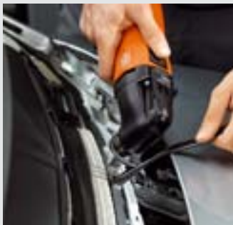
Mit dem Schabmesser entfernen Sie Restkleber ohne Kraftaufwand sauber und schnell. Empfohlene Geschwindigkeit: Stufe 2–3.