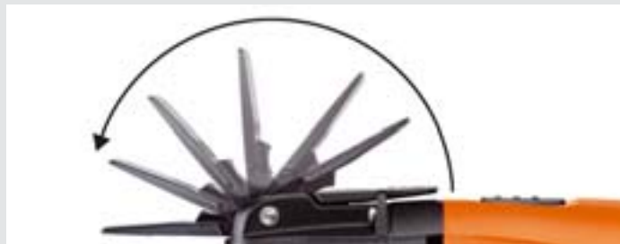
QuickIN-Getriebekopf für höchsten Bedienkomfort.

Getriebekopf ohne QuickIN niedrige Getriebehöhe, optimal bei beengten Platzverhältnissen beim Ausblasen