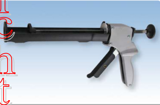
Original Design & Herstellung